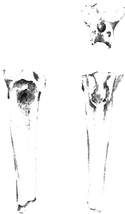
Fig. 2 - Tachybaptus ruficollis (Tuffetto): frammento prossimale di tarsometatarso sinistro: (sinistra) norma anteriore; (destra, in basso) norma posteriore; (destra, in alto) norma superiore (x 3) Tachybaptus ruficollis (Little Grebe or Dabchick): fragment of proximal left tarsometatarsus: (left) anterior view; (bottom, right) posterior view; (top, right) superior view (x 3)

Concludendo il tarsometatarso può essere attribuito a Tachybaptus ruficollis (Pallas).