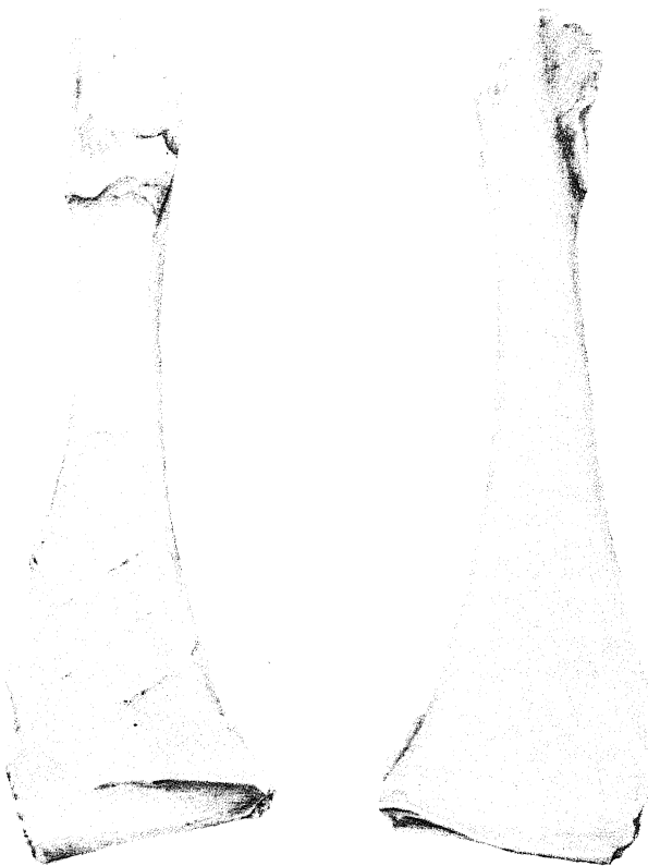
Fig. 1 - Anas platyrhynchos (Germano reale) - Coracoide sinistro: (sinistra) norma dorsale; (destra) norma ventrale (x 2.6) Anas platyrhynchos (Mallard) - Left coracoid: (left) dorsal view; (right) ventral view (x 2.6)

Il coracoide può essere quindi attribuito ad Anas cf. platyrhynchos Linnaeus.